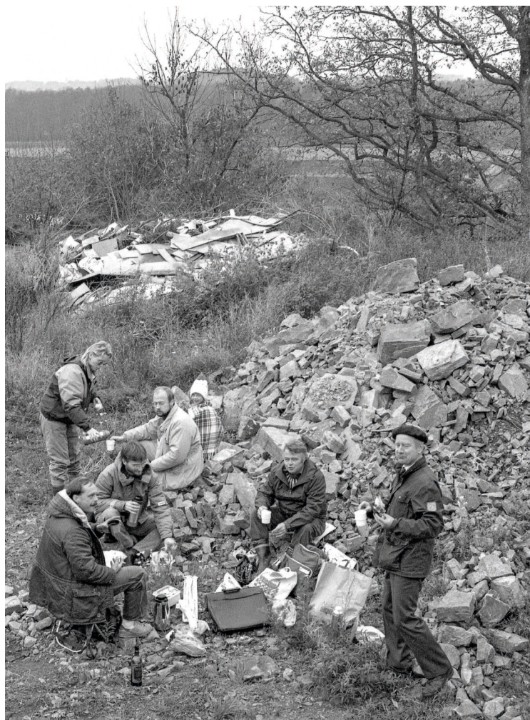
Vinlunch på Krigarebacken (passande namn!) vid Nackhälle.

Det finns så klart många fler berättelser med koppling till Lennart men de tar vi när det är dags för nästa vänbok! Om tio år!