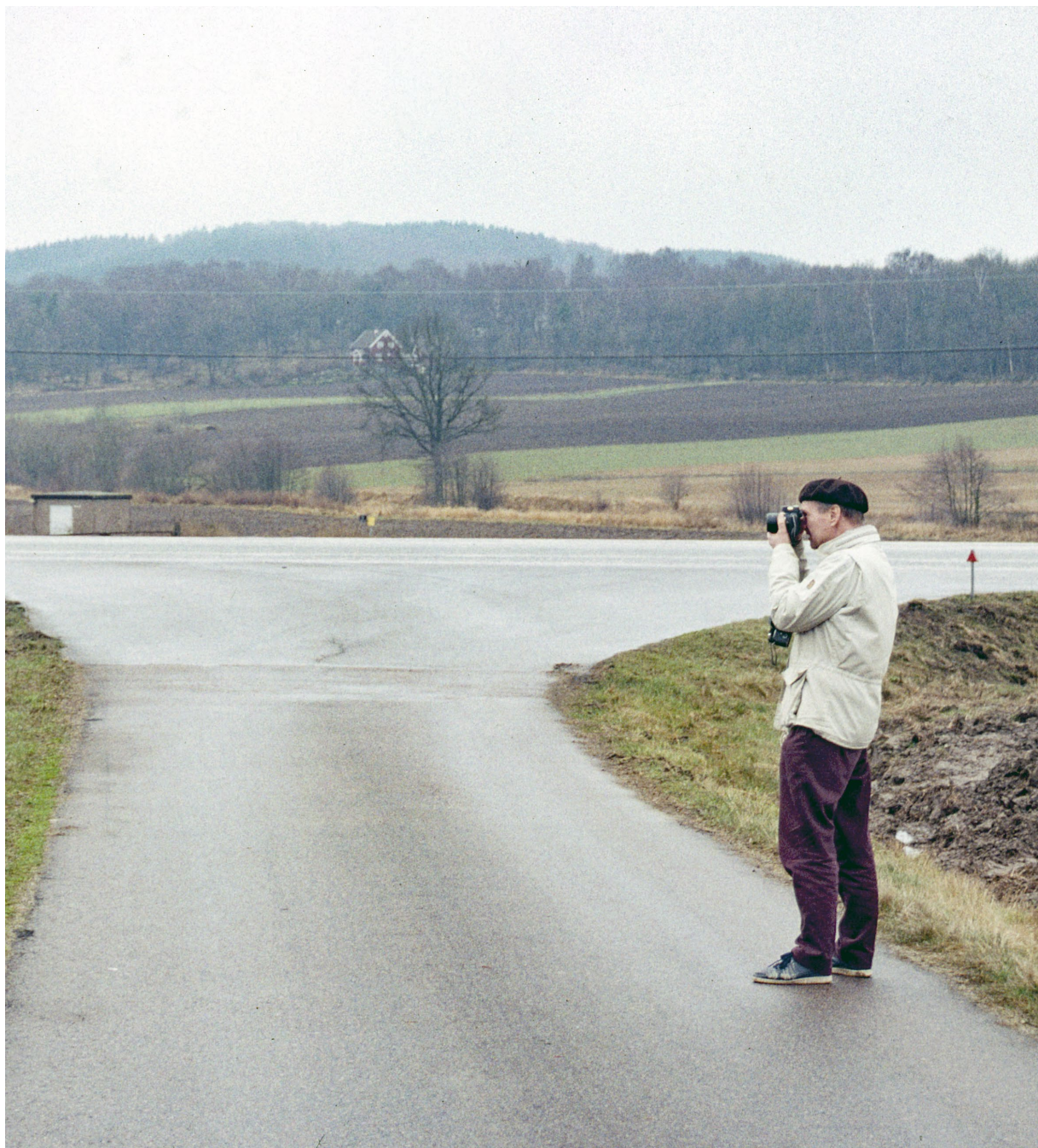
Lenart fotar Slöingeoplatsen som nyligen hade påträffats av Dennis Likus i Slöinge. Februari 1992. Foto: Lars Lundqvist. CC-BY